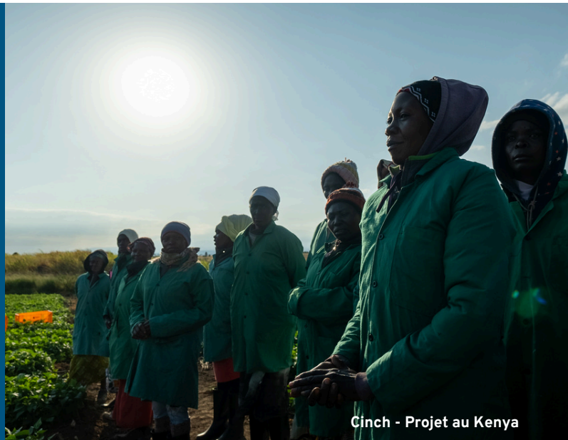
Cinch - Projet au Kenya